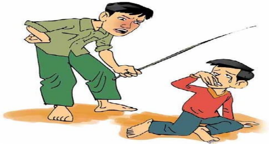
Gambar 2.6.1.Sumber: Positive Discipline and Classroom Management (CJPC, 2012)

Berdasarkan gambar tersebut, refleksikanlah dalam kolom yang telah disediakan. Apa yang terjadi dalam gambar? Kira-kira dalam gambar tersebut adalah penerapan disiplin atau hukuman? Dampaknya apa bagi kedua belah pihak?