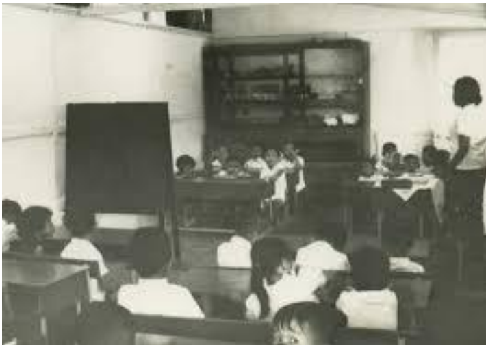
Gambar 2.1 a

Anda telah melakukan refleksi tentang budaya sekolah ketika menjadi murid dan menjadi guru. Untuk lebih mengaitkan proses refleksi di sesi berikutnya dengan materi tujuan esensi sekolah, Anda akan diajak untuk melihat budaya sekolah dalam potret lebih luas. Bila diminta menyebutkan kata-kata yang berhubungan dengan sekolah, kata apa saja yang mungkin keluar pertama kali? Papan tulis? Bangku? PR? Jika kita diminta membayangkan situasi kelas gambar seperti di bawah ini situasi kelas seperti apa yang terbayang? Apakah seperti gambar di bawah ini?