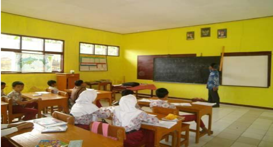
Gambar 2.1b

Dua gambar tersebut menjadi bukti bahwa pendidikan tidak mengalami perubahan signifikan, sedangkan salah satu elemen penting dalam kelas yang berpengaruh pada kualitas pendidikan adalah hubungan guru dan murid (Ben Johnson, 2016 dalam edutopia.org). Hubungan guru dan murid adalah faktor penting dalam membangun budaya sekolah. Untuk lebih memahami kaitan hubungan guru dan murid dengan budaya sekolah, Anda bisa melihat video berikut ini. Selamat menonton!