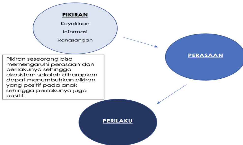
Gambar 2.6.6

Dalam mengembangkan visi, kita perlu untuk meninjau kembali asumsi dari para pemangku kepentingan, melalui pikiran dan perasaan dari perilaku yang muncul. Asumsi guru dalam mengajar tentu berkaitan dengan perilaku yang ditampilkan oleh murid kita. Di bawah ini mari kita lihat hubungan perilaku sebagai wujud akhir dari pikiran dan perasaan yang dimiliki oleh murid.