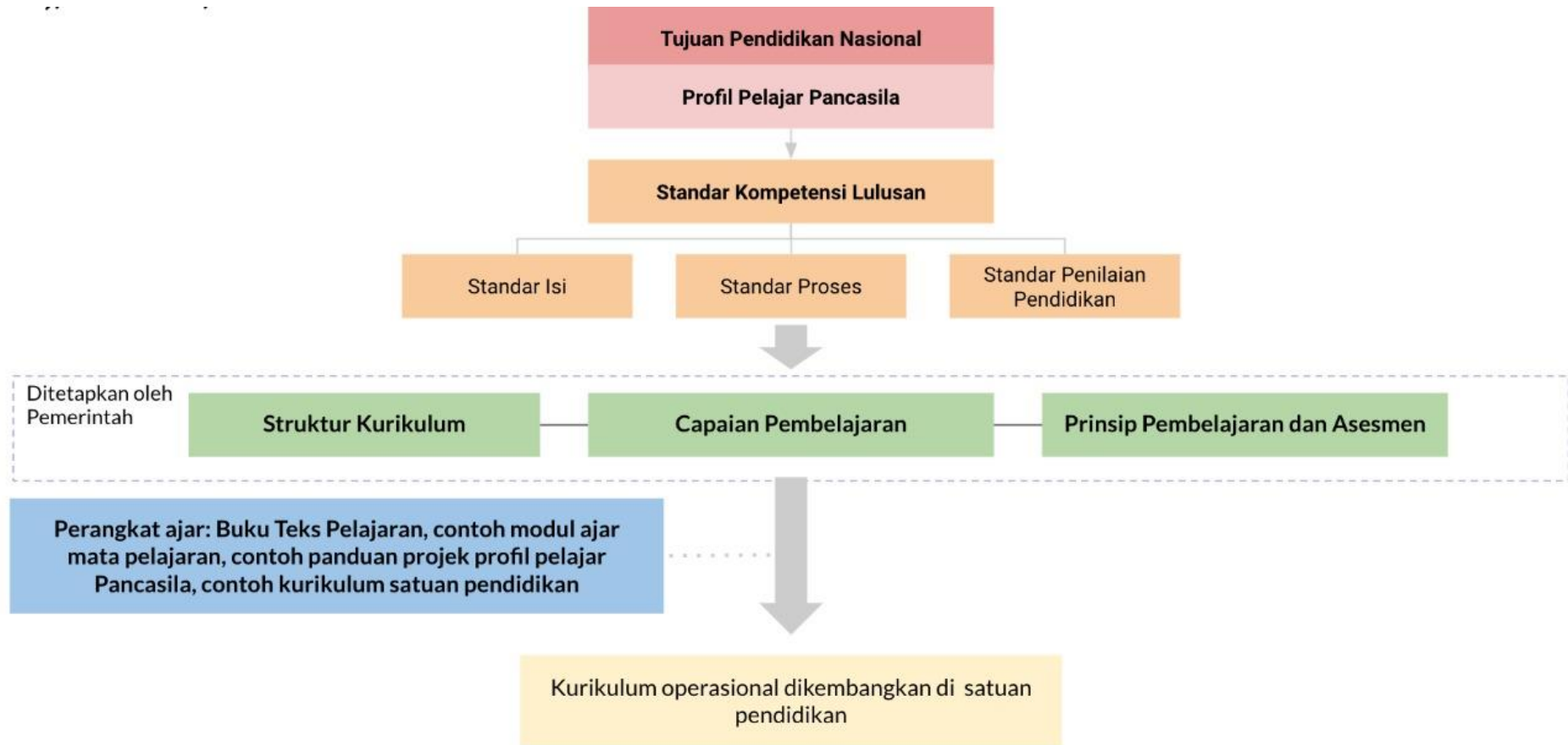
Gambar 1. Hubungan antara kerangka dasar kurikulum, contoh perangkat ajar, dan kurikulum operasional di satuan pendidikan